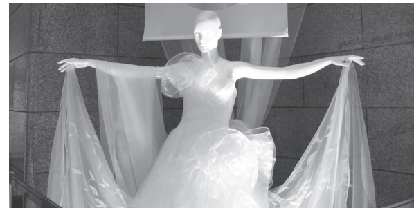
先染絹織物を使用したウエディングドレス