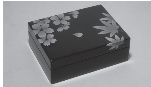
オリジナル蒔絵の小物入れ