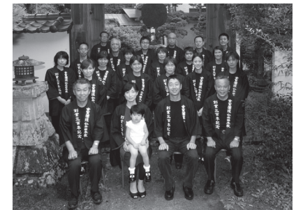
日本の田んぼを守る酒蔵を目指す蔵人たち