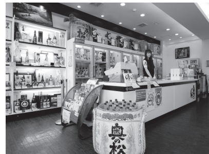
お酒の試飲ができる酒蔵ギャラリー