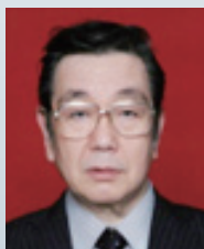
在メダン日本国 総領事