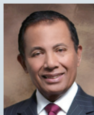
ダルマブルサダ大学 学長