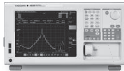
AQ6380 1200~1650 nm