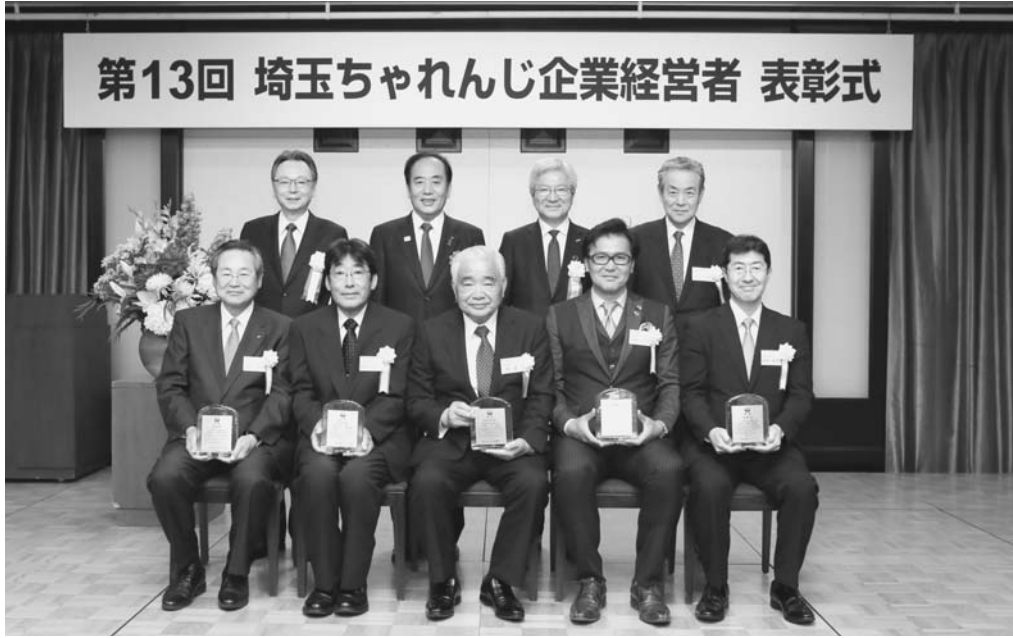
栄えある第13回受賞者